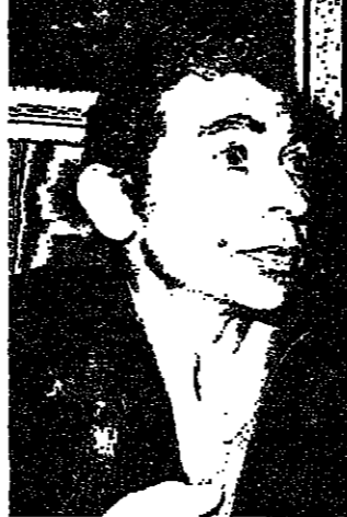
يوسف شاهين : كنت وحدي

ويقول يوسف شاهين عن تجربته : عندما كنت يافعا وكنت مترجما من ذاتي رحت ابحت في الكتب ولم اجد شيئا ، وكنت وحدي ، وحين كنت اقول لاحد ما : «عندي احساس لا اجدها في من حولي» كان هو نفسه يتزعج ، ويقل «علي ان اكون